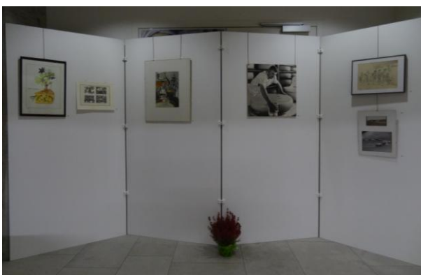
Abb. 3: ROST-Kulturnacht-Ausstellung im Kornhaus Burgdorf