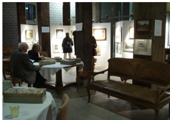
Abb. 4: „Burgdorf“-Teil der ROST-Kultur Nacht-Ausst., mit AGR-Dokumentationen (Karteikästen).