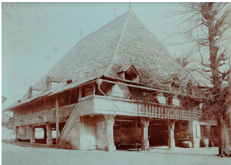
Abb. 3: Kramlaube in Langnau, Fotografie um 1900, zur „Käsehäuser-Führung“ von Madeleine Ryser und Ernst Roth im Rahmen des Berner Heimatschutzes und der Europäischen Tage des Denkmals.