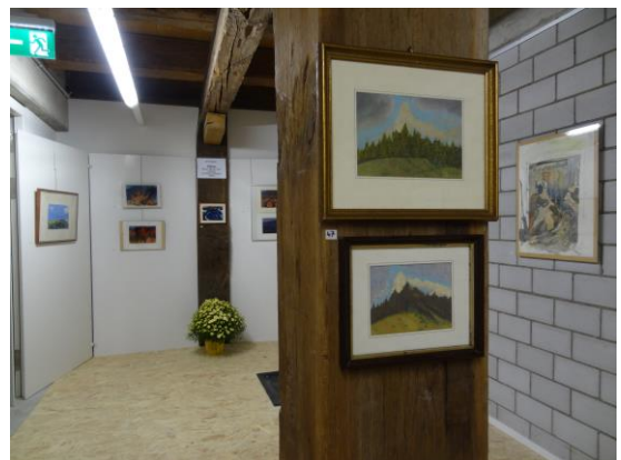
Abb. 5: ROST-Kulturnacht-Ausstellung, Kornhaus Burgdorf 2015