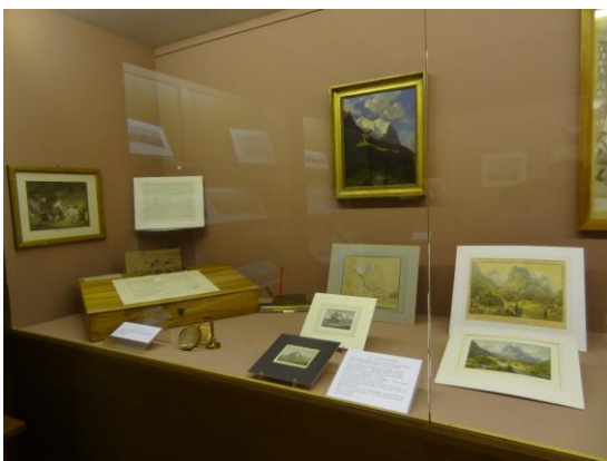
Abb. 4: „Delightful Horror“-Sonderausstellung im Schloss Hünegg 10.5.-18.10.2015 (Raum B)