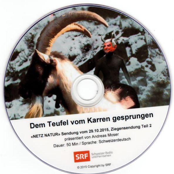
Abb. 2: SRF-Fernsehsendung „Netz Natur“